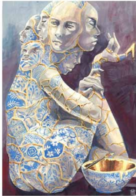
Illustratie van Myriam Tillson