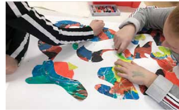
Kunstlab in de klas; zelf ook een 'Katherina Grosse' maken

Met het programma van Kunstlab wordt er een brug