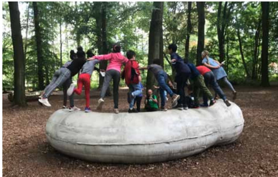
24 Maak het mee met Kunstlab