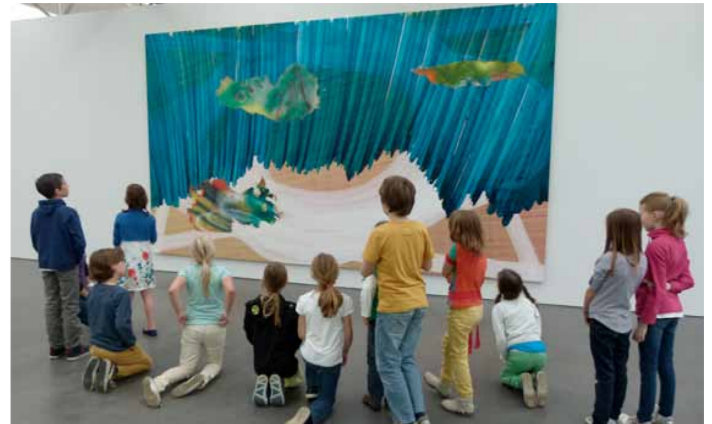
Kunstlab in De Pont; bij het werk van Katherina Grosse

In een serie lessen onderzoeken kinderen hoe kunstwerken zijn gemaakt. Ze gaan dit met eigen handen zelf ontdekken. Iedere les staat een ander materiaal en techniek van een kunstenaar centraal. Belangstelling of meer weten? kunstlab@taborsky.nl