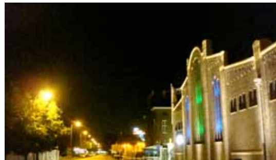
10 De nacht valt over de stad