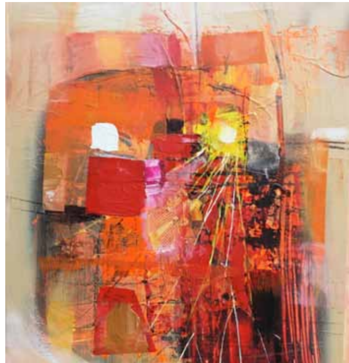
4 Avdia Avrumutoae